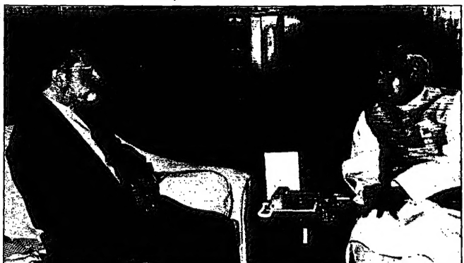
القميص المكن حلقس العربي